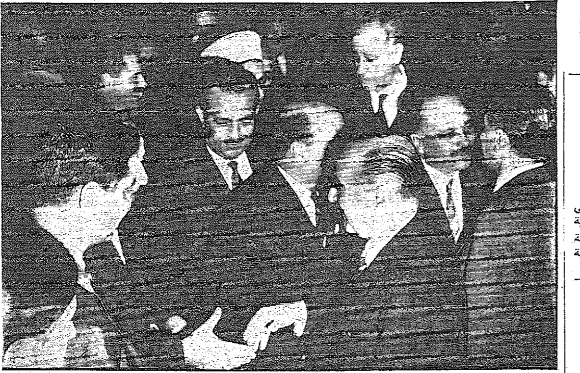
دولة السيد بهجت التلهوني رئيس الوزراء والسيد عبد المنعم الرفاعي وزير الخارجية لدى وصولهما إلى مطار عمان مساء أمس عائدتين من القاهرة والرياض

عمان - صرح ناطق عسكري أردني بما يلي: في الساعة التاسعة والنصف من صباح اليوم - أمس - بدأ العدو بإطلاق النار من الرشاشات المتوسطة والمدافع الهاون والبنادق على مناطق جسر الجامع والمعصرة والقنصلية والصبراء والبركات وبوادي الأردن الشمالي. ردت قواتنا على النار بالقلوب والرشاشات المتوسطة والمدافع الهاوية. وعشرة حيث توقفت. لم تقع أية خسائر بين قواتنا أو بين المدنيين. وفي الساعة السابعة وخمسين دقيقة من مساء أمس فتح العدو نيران الرشاشات المتوسطة ومدافع جسر 1.6 ملترات باتجاه قواتنا جنوبي جسر الأمير محمد - دامية - بمسافة سبعة كيلو مترات. ردت قواتنا على النار بالقلوب والرشاشات المتوسطة والمدافع الهاوية. وفي الساعة العاشرة والنصف قامت طائرتان مقاتلتان للعدو من طراز مستر